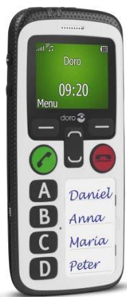
Figur 2 Doro