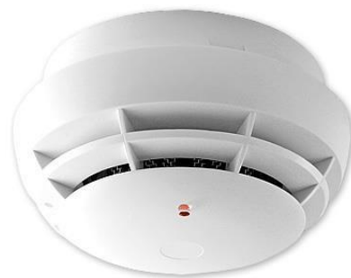
Figur 9 Røykvarsler