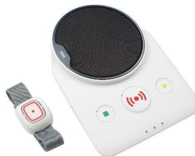
Figur 1 Digital trygghetsalarm