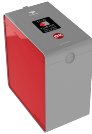
Figur Evodos medisindispenser 14