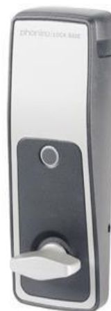
Figur 7 Døralarm eLås