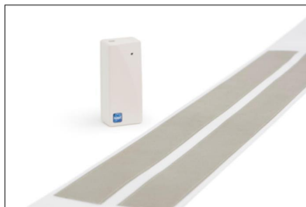
Figur 10 Senqesensor