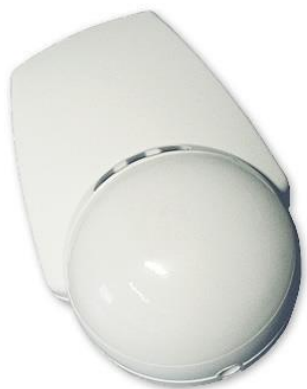
Figur 8 Bevegelsessensor