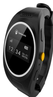
Figur 5 Safemate klokke