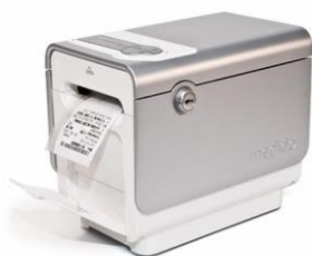
Figur 12 Medido medisindispenser