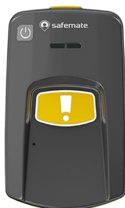
Figur 3 Safemate