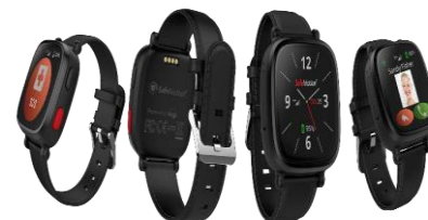
Figur 4 SafeMotion