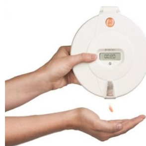
Figur 14 Pilly Medisindispenser