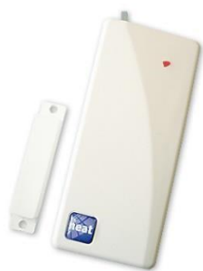
Figur 11 Døralarm