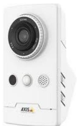
Figur 6 AXIS Digitalt tilsyn kamera